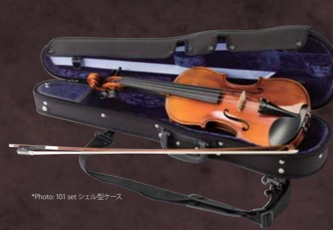
*Photo: 101 set シェル型ケース

これらのセットは、初めて楽器を持たれる方にお薦めの内容となっております。特に、楽器本体とバランスの良い弓が付属されている点は、他のセット商品には無い魅力のひとつです。難しい弓の選定や小物選びを省き、購入したその日から、すぐに楽器が弾けるセットはお薦めです。