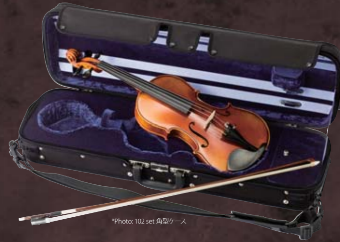
*Photo: 102 set 角型ケース