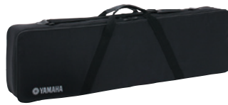
ソフトケース SC-HD200 13,650円(本体価格/13,000円)