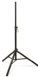
ULTIMATE スピーカースタンド TS-70B 10,290円(本体価格/9,800円)