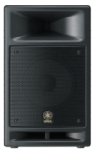
学校用モニタースピーカー SMS100 58,800円(本体価格/56,000円) お問い合わせ/ ヤマハ(株)管弦打学校営業部 03-5488-1686 ※SMS100にスタンドTS-70Bを取り付ける場合は マウンティングブラケットBMB200が必要です。