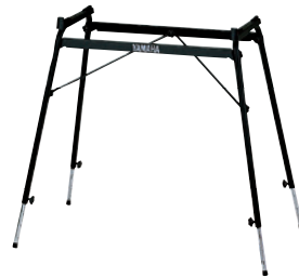
スタンド HDS-100 13,650円(本体価格/13,000円)