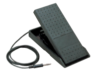
フットコントローラー FC-7 6,300円(本体価格/6,000円)