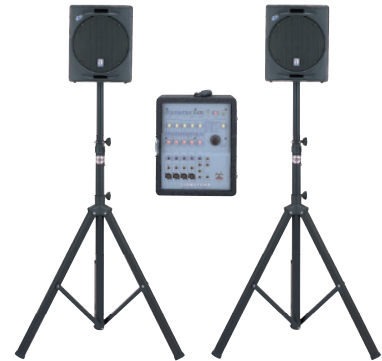
VISCOUNT PAシステム COMBO-55 84,000円(本体価格/80,000円) ※スタンドTS-70Bは別売になります。