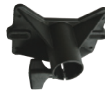
ULTIMATE マウンティングブラケット BMB200 5,250円(本体価格/5,000円)