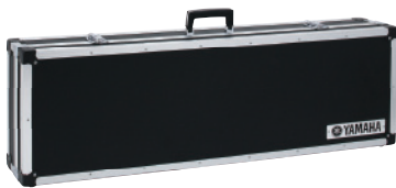
ハードケース HC-HD200 24,150円(本体価格/23,000円)